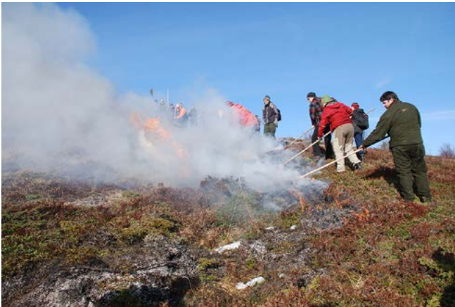
Lyngbrenning på Skeisnesset.

Kystlyngheiene er et resultat av 4000 år med husdyrbeiting og lyngbrenning. Røsslyngen var tidligere verdifullt vinterbeite for dyr som gikk ute hele året. I dagens høyproduktive landbruk nyttes ikke lyngheiene lengre, og landskapet gror igjen. Kystlynghei er en trua naturtype, og det er viktig å ta vare på noen av de områdene som fortsatt finnes i Norge. Blant disse er Skeisnesset. Her drives målretta skjøtsel med rydding, brenning og beiting med storfe og sau.