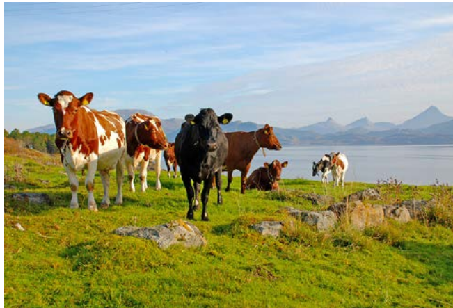
Skeisnesset er et felles beiteområde for gårdene på Skei.

Fortsatt jord- og husdyrbruk er helt nødvendig for bevaring av kulturlandskapet. Det er 12 landbrukseiendommer i området. De fleste har husdyr, og bøndene gjør en viktig innsats ved å tilpasse drifta slik at kulturlandskap og miljøverdier bevares. Det er et viktig mål å øke husdyrholdet for å hindre gjengroing.