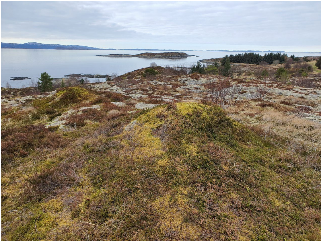
Figur 2: Haug med organisk masse, sett mot SV.

Planområdet består av delvis nakne, slake berg bevokst med mose, lyng og einer. Det var en haug på toppen av det høyeste partiet med berg, men stikk med jordbør viste at den bestod av organisk materiale. Likedan var det flere hauger på bergflaten i nord, men alle var organiske. Det ble ikke gjort funn av automatisk fredete kulturminner.